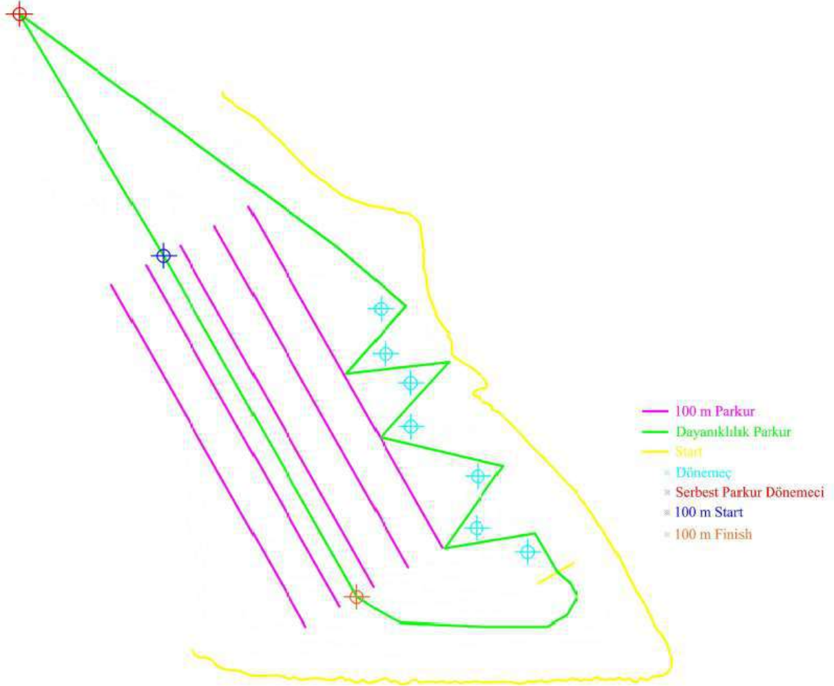
Yarış parkurunun detaylı bilgileri